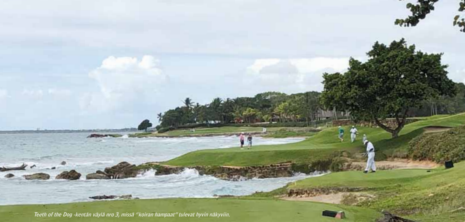
Teeth of the Dog -kentän väylä nro 3, missä "koiran hampaat" tulevat hyvin näkyviin.

dollaria, joten täälläkin jouduimme hautaamaan haaveet uusintakierroksesta.