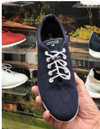
Mallorcalainen perinteikäs perheyriitys Lottusse aloitti golfkenkien valmistuksen 2013 ja pyrkii nyt USA:n markkinoille.

Messuohjelmaan uumoillaan tulevan muutoksia, kun PGA of American pääkonttori siirtyy Floridasta Teksasin Friscoon 2022. Las Vegasin PGA Expon veikkaillaan olevan ensimmäisenä siirtolistalla. Jatkuvuutta tapahtumille kuitenkin takaa se, että Callaway Golf julkisti joulukuussa 2019 uuden monivuotisen yhteistyösopimuksen. Yhtiö on ollut mukana tässä golfin Majorissa 37 vuotta. ■