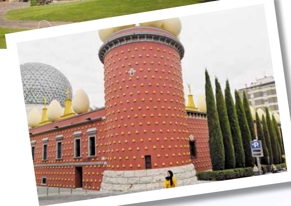
TorreMironan vieressä sijaitsee Salvador Dalin synnyinkaupunki Figueres. Sieltä löytyy myös runsaasti nähtävää ja koettavaa tarjoava leivillä koristettu Dalin museo.