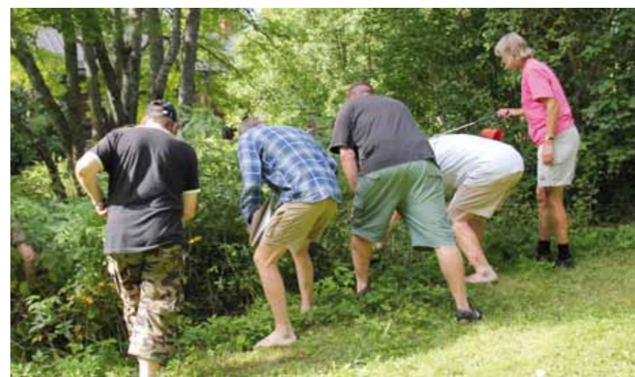
Oiva esimerkki siitä, että pihagolf ei oleellisesti osiltaan poikkea "oikeasta" golfista. Pallo katoaa mitä ihmeellisimpiin paikkoihin ja sitä etsitään kissojen ja koirien kanssa. Kuva vasemmalla.