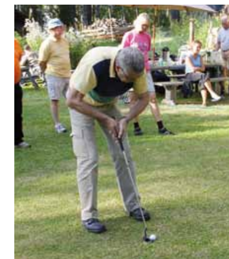
Kyllä lähtee! Avaussyönti tehdään ns. kevytpallolla, jotta suuremmilta vahingoilta säästytään. Tyyli-pisteitä ei anneta, vain lopputulos ratkaisee. Kuva ylhäällä vasemmalla.