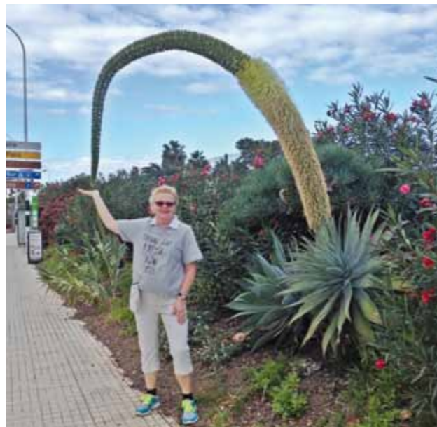
Luonnon ihmeet kiinnostavat missä ikinä kuljenkin. Tämä ihmeellinen kasvi löytyi Teneriffalta Golf del Sur -kentän kupeesta.

Aikaisempia työnantajiani ovat olleet mm. Haka ja Skanska, joiden palveluksessa olin vuosia myös Pietarissa. Pietarin vuodet toivat ”keittiövenäjän” taidon ja espanjaa olen opiskellut loma-asuntokauppiiaan töitä varten. Työ opettaa ja motivoi.