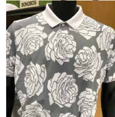
Näin meidän pitäisi pukeutua tulevalla kaudella. Isot kirjavat ja näyttävät kuviot ovat päivän sana, mutta vielä löytyy hillitympää yksiväristäkin kuosia.