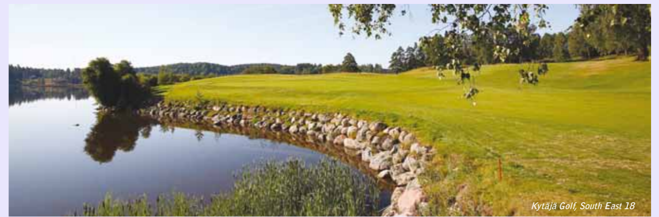
Kytäjä Golf, South East 18