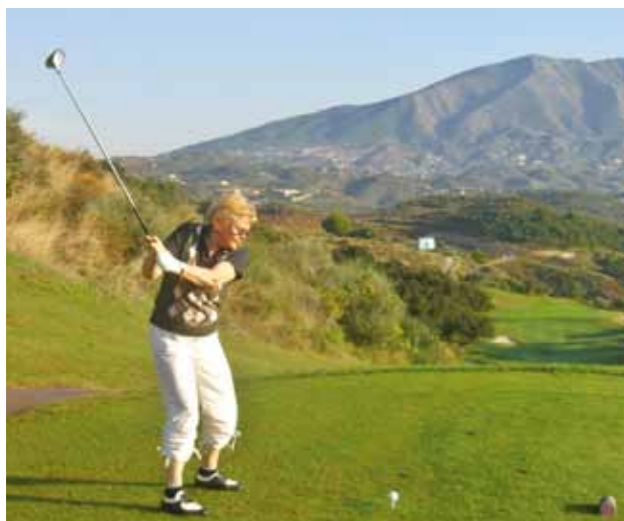
Ulkomailla pelaaminen tuo harrastukseen hauskuutta ja vaihtelua, kuten tässä La Calan Campo Asia -kentän 15. väylällä Etelä-Espanjassa.