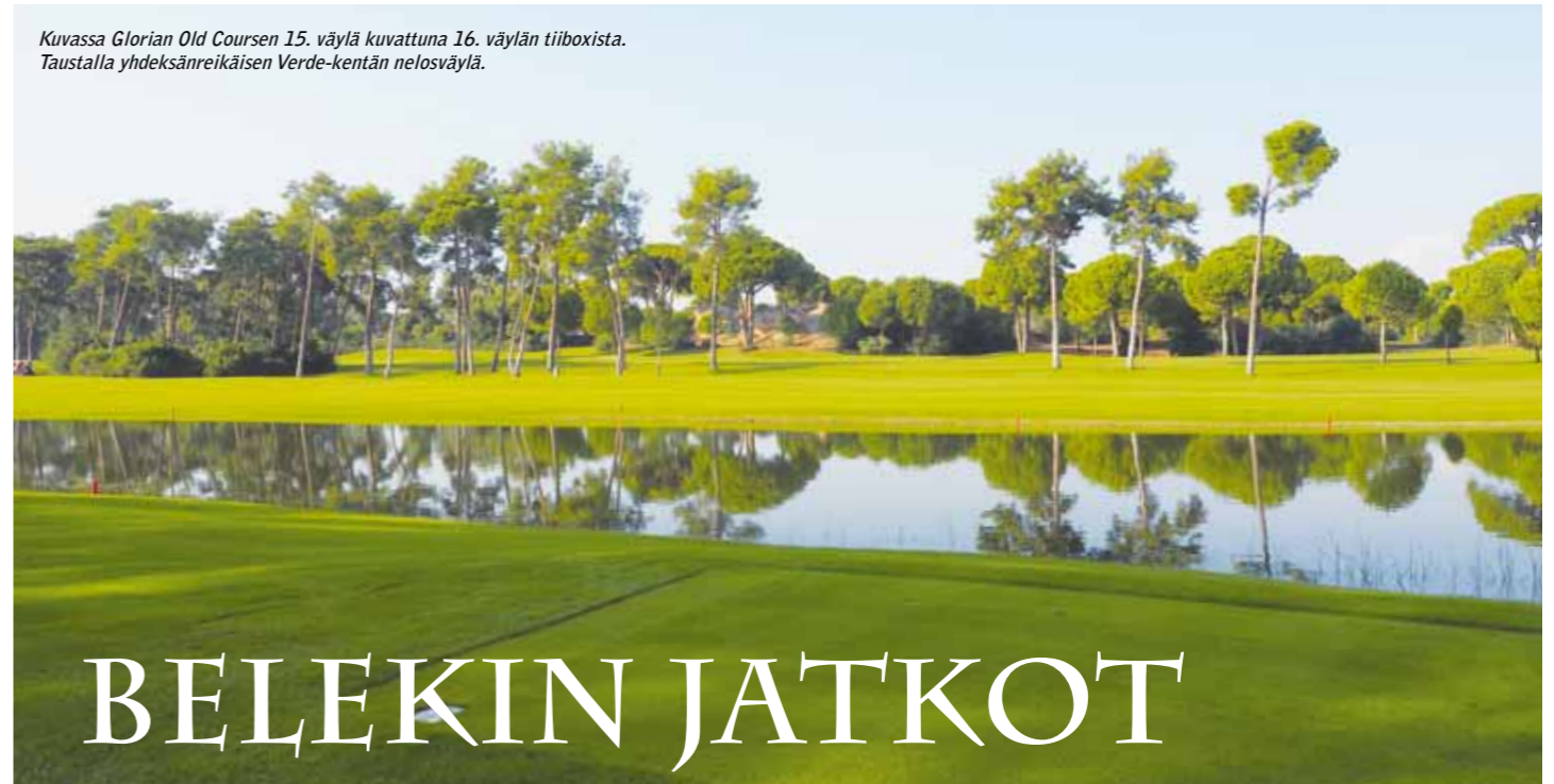
Kuvassa Glorian Old Coursen 15. väylä kuvattuna 16. väylän tiiboxista. Taustalla yhdeksänreikäisen Verde-kentän nelosväylä.