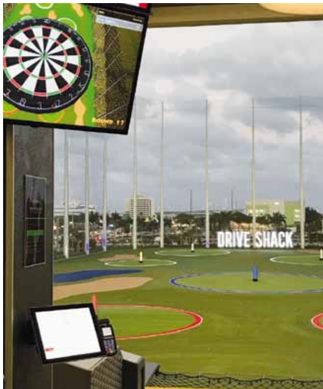
Driving ranget ovat siirtyneet sisätiloihin ja niistä on tehty varsinaisia viihdekeskuksia. Drive Shack on yksi alan yrityksistä.

Drive Shack kuuluu samaan konserniin 60 golfkenttää operoivan American Golfin kanssa. Strategiansa mukaisesti konserni on viimeisten vuosien aikana luopunut 24 golfkenttäomistuksesta ja pyrkii eroon vielä kahdesta jäljellä olevasta. Sisäpelaaminen tarjoaa paremmat businessmahdollisuudet, kun se sopii joustavammin nykyihmisten sosiaaliseen elämään.