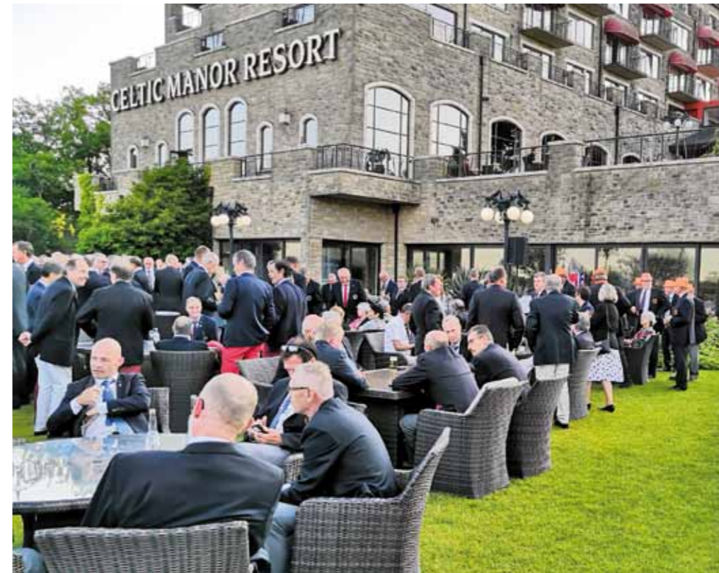
Ennen illallisbanketin alkua osanottajat kokoontuivat Celtic Manor Resortin komean klubi- ja hotellikennuksen eteen.