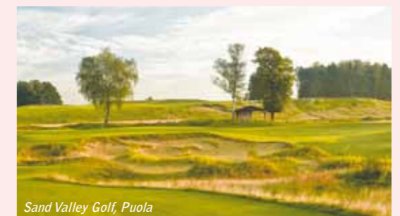
Sand Valley Golf, Puola

Tarkemmat tiedot ulkomaan erikoispaketeista löytyvät SGS:n nettisivuilta: www.suomengolfseniorit.fi