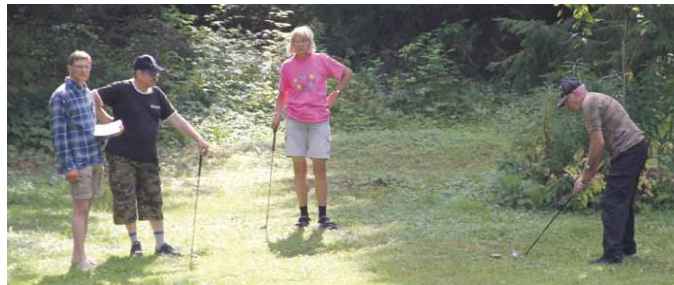
Aloitussyönti vaatii tarkkaa keskittymistä pihagolfissakin – varsinkin kun kriittinen yleisö on aivan sormituntuman päässä.

Kun kevytpallo saavuttaa maastoon merkityn vaihtorajan, se vaihdetaan oikeaan golfpalloon, jolla loppulyönnit pelataan. Vaihtoraja kannattaa katsoa paikkaan, josta lippua voi lähestyä turvallisesti koviksella chipaten.