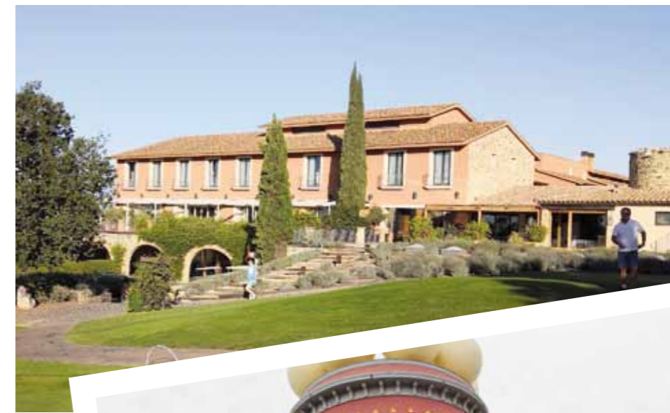
Peraladan Golf Resortin yhdistetty hotelli- ja klubirakennus.